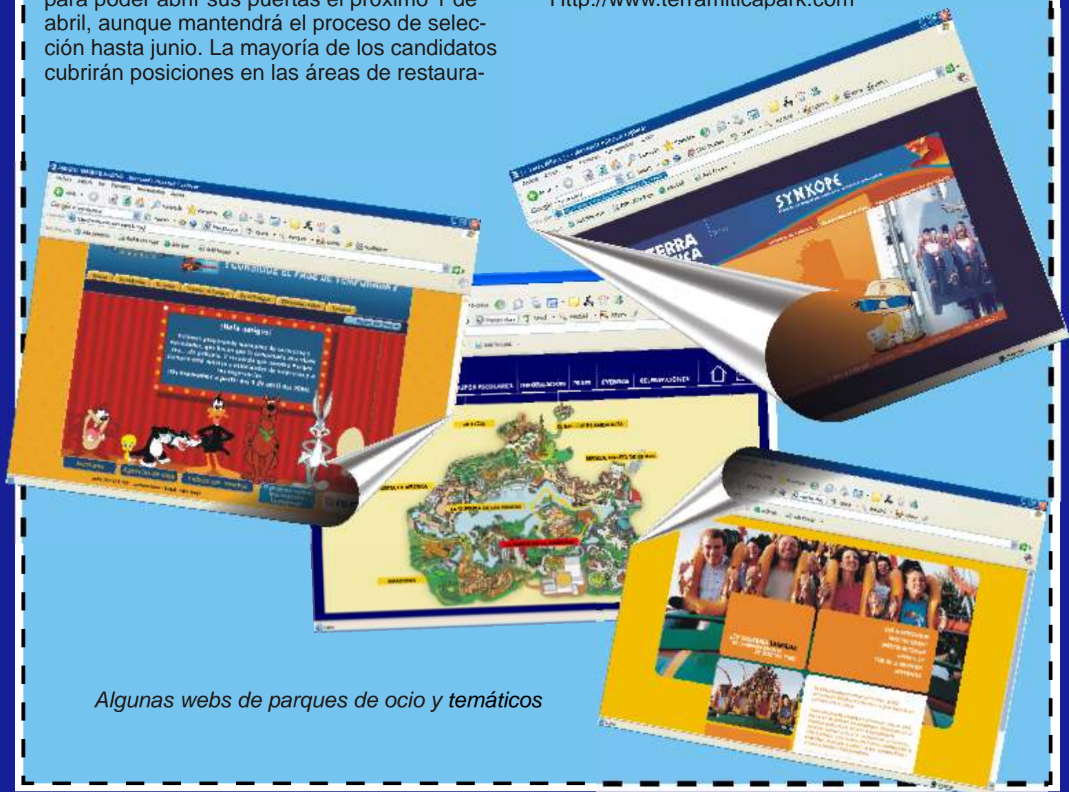
Algunas webs de parques de ocio y temáticos