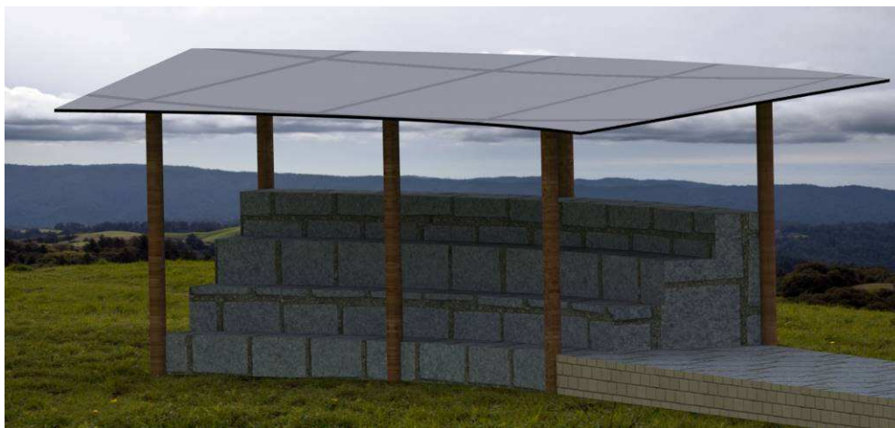
Ilustración 2 (Modelo 3D del anfiteatro terminado con techumbre)