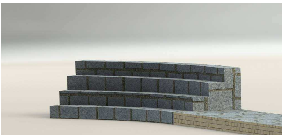
Ilustración 1( Modelo 3d del anfiteatro terminado después de la ejecución del presente proyecto)